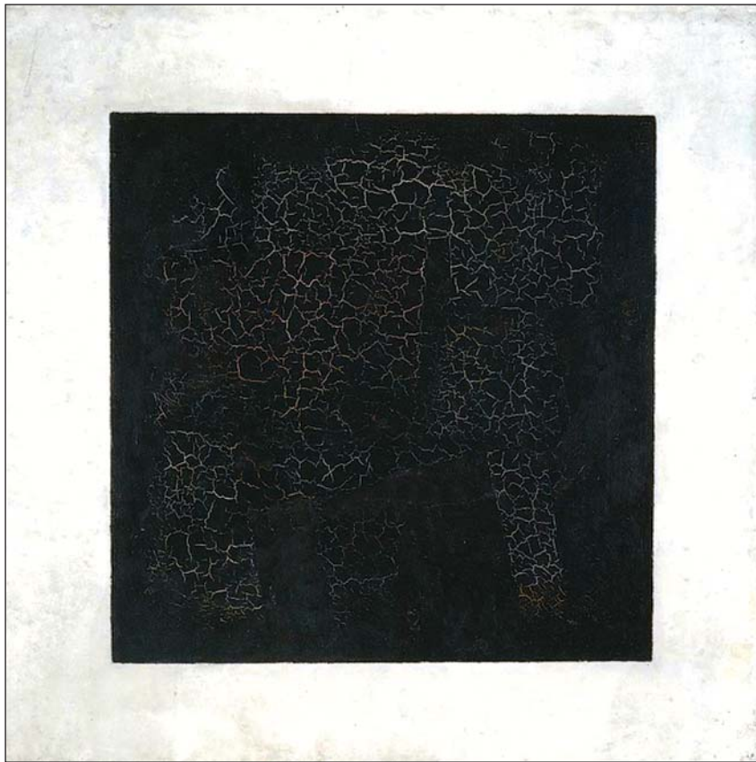
Рис. 4. Казимир Малевич. Чорний квадрат. 1915 р.

сальну енергію ударів, вчинили руйну побережжя і повну зміну обрисів акваторії. Невідомо, які жертви були серед населення міст та інших поселень узбережжя Меотиди, затопленої водами й перетвореної на опріснений морський басейн.