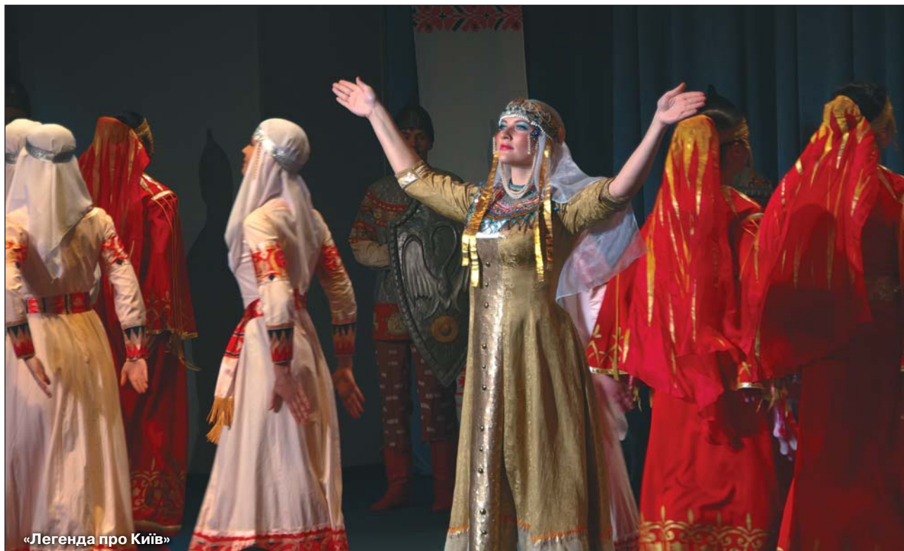
«Легенда про Київ»

Час неухильно збігає, відмірюючи хвилинами, годинами, роками для кожної людини її долю... Ось уже і юна, свіжа й нестримна, як подих вологого й теплого вітру, «Веснянка» святкує свій 55-й день народження.