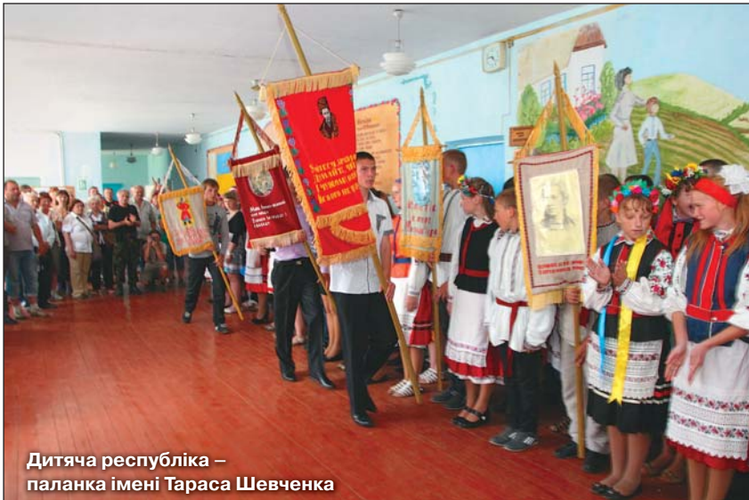
Дитяча республіка – паланка імені Тараса Шевченка