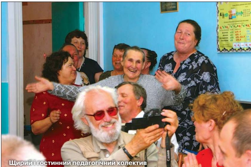
Щирий і гостинний педагогічний колектив

в ній навчалось 63 дітей (5 дівчат, решта – хлопці). У 1935 р. отримала статус семирічної, в з 1952 – середньої. З 1989 р. заклад перенесено у нове приміщення, де ми й побували.