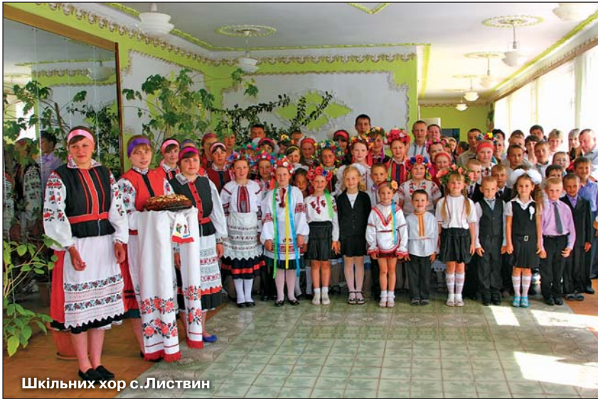
Шкільних хор с.Листвин