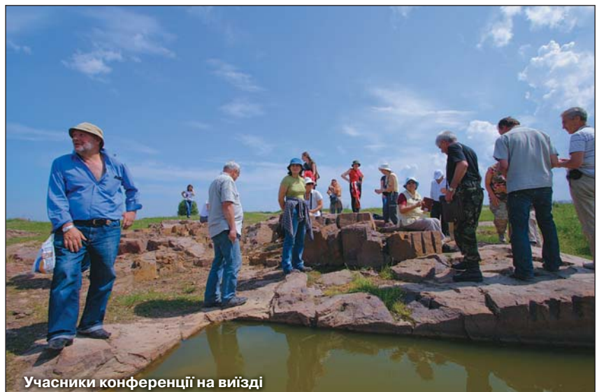
Учасники конференції на виїзді