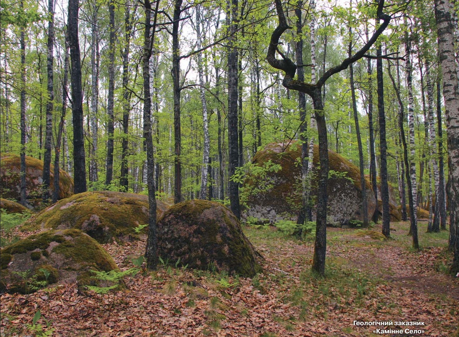
Геологічний заказник «Камінне Село»